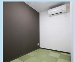
2階 更衣室・シャワー室・休憩スペース