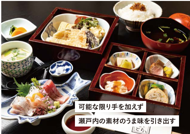
可能な限り手を加えず 瀬戸内の素材のうま味を引き出す

各拠点のSUENAGA Groupスタッフが おすすめのグルメを紹介！ 水島エリアへ訪問する際にはぜひ参考にしてみてください。