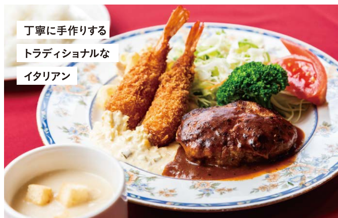
丁寧に手作りする トラディショナルな イタリアン

手作りハンバーグ&エビフライセット(1,300円)。エビの殻をむき、一尾ずつ丁寧にパン粉を付けて揚げるエビフライのふりふりサクサクの食感が絶妙です。