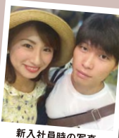
新入社員時の写真

入社1年目に出会ってから、こちらも10年経ちます。奥さんに対して「10年表彰」を実施したいと思います(照笑)。