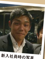
新入社員時の写真

日々の業務をこなすことに精一杯でした。今思うと、周りのことが全く見えていませんでした。反省しています。