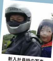
新入社員時の写真

バイクの後ろに子どもを乗せて(くくりつけて)、いざ、岡山空港へ!あれから10年、今でもバイクツーリングはやめられない!!