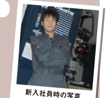
新入社員時の写真

最初はアルバイトから入りました。そこから、社員に登用されたことをとてもうれしく感じたことを覚えています。