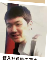
新入社員時の写真

当時は諸先輩方に迷惑ばかりかけていましたが、周りの方々に助けられ、何とか10年続けられました。これからは先輩・後輩を助け、頼りになる存在になれるよう頑張っていきます。