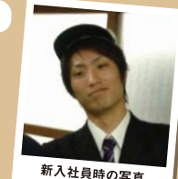
新入社員時の写真

当時の写真を見ると「あの頃は若かったな〜」と恥ずかしくて苦笑いしてしまうけれど、自分なりに頑張っていましたね。