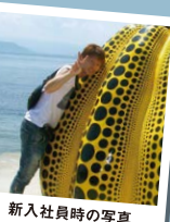
新入社員時の写真

仕事と遊びの両方とも、全力で楽しんでいました。今よりもかなり体が引き締まっていたいな。