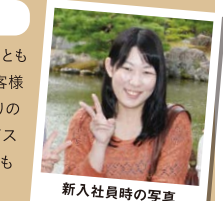
新入社員時の写真

車両のこともリースのことも最初は知識不足で、お客様に教えてもらうほど。周りの方にフォローやアドバイスいただけることが、とてもありがたかったです。