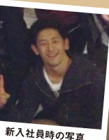
新入社員時の写真

この写真は、入社記念の時に撮っていただいたものです。重役の方々もいらっしゃるので、とても緊張しています。