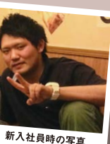
新入社員時の写真