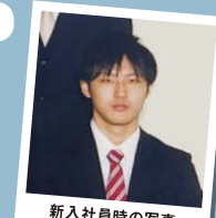
新入社員時の写真