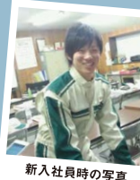
新入社員時の写真

入社したばかりの頃は不安でいっぱいでしたが、「E.Stage香登」の皆さんにいろいろ教えてもらい、不安が自信に変わっていききました。あの頃があったから今の自分があるのだと思います。