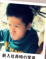
新入社員時の写真

当時は毎月、旅行に行っていました。今は家族も増えたので、また、あの頃のように「いろんな所へ行けたらいいな!」と思っています。