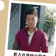
新入社員時の写真

新入社員時は、毎日「筋トレ」をしていたことを思い出しました。また「再開しようか」と考えています。