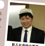
新入社員時の写真

入社時の写真を見れば、とても緊張していることが分かります。10年経ちますが、当時の気持ちを大切に、この先も精進していきたいと思っています。