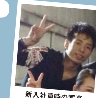
新入社員時の写真