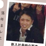
新入社員時の写真

入社当時は世間知らずで、落ち着かない日々でした。10年経ってもあまり変わっていませんが、当時の自分に「ブレない心で頑張れば良いこともある」と言っていた!