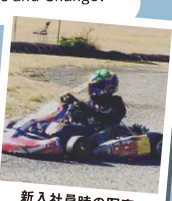
新入社員時の写真