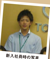
新入社員時の写真

結婚しました! たくさんの方々に助けていただきました。今思い返しても感謝の気持ちでいっぱいです。ありがとうございました!