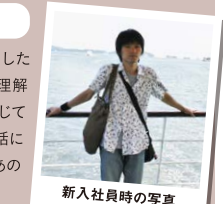
新入社員時の写真

営業スタッフとして入社した当初、リースの仕組みを理解していないまま商談に応じていたので「お客様との会話に困ったりしていたなあ」。あの頃を懐かしく感じます。